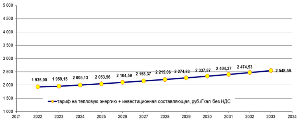
Рисунок 15.1 – Тариф на тепловую энергию для потребителей ООО «Сервисная Коммунальная Компания» при реализации строительства источников тепловой энергии и тепловых сетей с.п. Антоновка