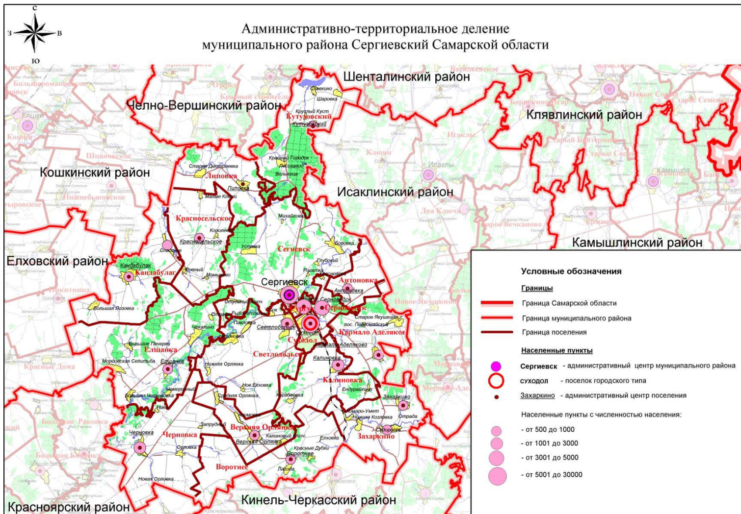
Рисунок 1 - Расположение с.п. Антоновка